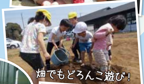
畑でもどろんこ遊び!