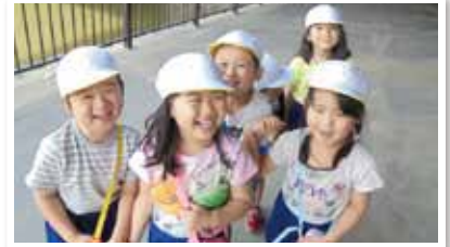
みずべこどもの家の園舎と 相模会の仲間たち