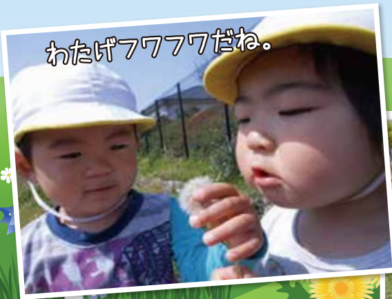
わたげフワフワだね。