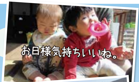
お日様気持ちいいね。