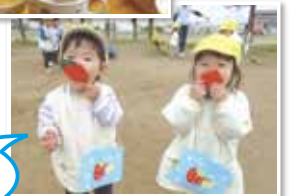
おともだちとあそぶのたのしー!