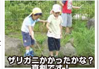
ザリガニかかったかな？ 真剣です！