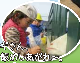
ヤギさん、 ご飯めしあがれ〜。