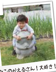
☆このかえるさん!大好き!