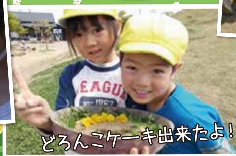
どろんこケーキ出来たよ!