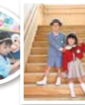
楽しいイベント盛りだくさん♪