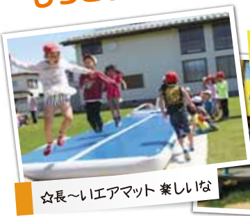
☆長~いエアマット 楽しいな