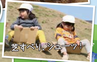
苺すべり、シユーツ!