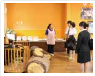
バスツアーの様子