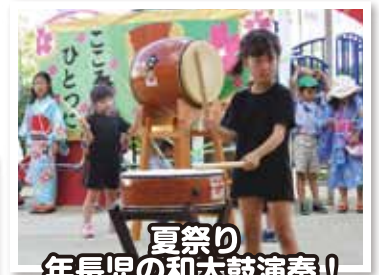
夏祭り 年長児の和太鼓演奏！