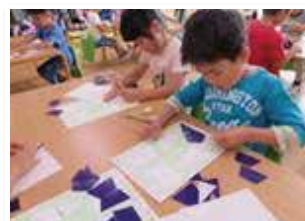
SIあそびは楽しいな