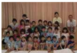
お泊り保育楽しかったね