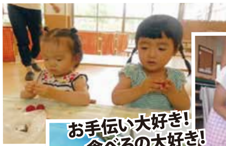
お手伝い大好き! 食べるの大好き!