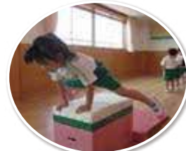
跳べるようになったよ