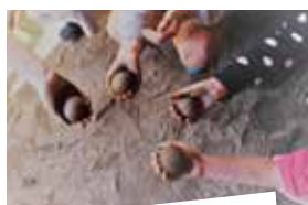
集中力・根気強さを育む

土と水があればすぐに始められるどろだんご作り。水を含んだ泥をきれいな形に丸めよく乾燥した白砂をかけては磨いてを繰り返しながらツヤを出していきます。大人も子供も、夢中になれる遊びです。どろだんごを作っている時は子供達とゆったりとした時間が生まれ、子供の気持ちを聞ける良いチャンスです。