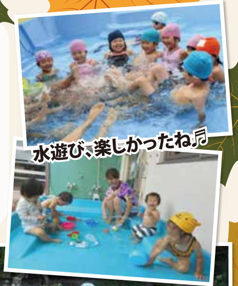
水遊び、楽しかったね♪