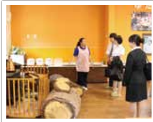
バスツアーの様子