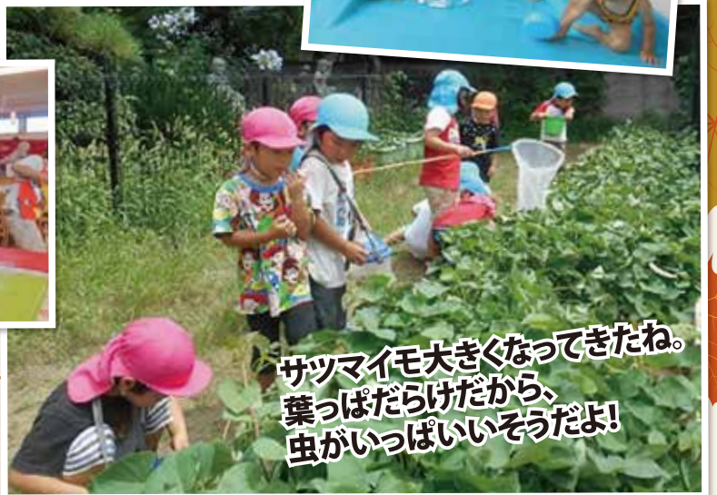
サツマイモ大きくなってきたね。 葉っぱだらけだから、 虫がいっぱいそうだよ!