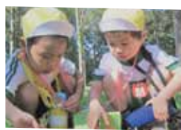
創造力・五感を育む

落ち葉や木の実など自然の素材で遊ぶ事で子供達は五感を使いながら、創造力を豊かにしていきます。遊び心を育てるうえでも格好な遊びとも言えるでしょう。落ち葉を集め「焚き火遊び」「葉っぱの雨」など創造力が膨らみます。子供と作るどんぐり作品を長く保管しておく為のポイントは一度お湯で沸騰させよく乾かす事です。どんぐりコマやどんぐりトトロなどお子さんと一緒に作ってみて下さい。