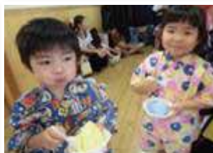
本物みたいでしょ!

URL: http://www.tohokai.or.jp/minamikoshigayahoikuen/