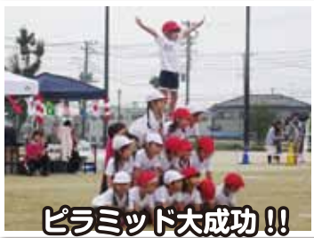
ピラミッド大成功!!