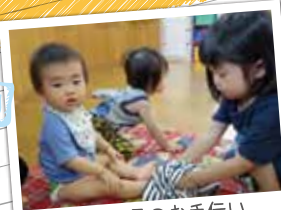
小さい子のお手伝い