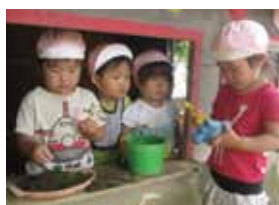
社会性・コミュニケーション能力

子供達が2～3人集まるとすぐに始まる遊びです。女の子の一番人気は「おかあさんごっこ」。子供達はお家でのお母さんの会話や仕草を良く観察していて、本当のお母さんになりきっています。男の子は「闘いごっこ」など。一見はげしい遊びに見えますが闘いの中で加減をしたり、思いやりも生まれます。ごっこ遊びを通して社会性や言葉の能力も高まる子供達にとっては大切なあそびとも言えます。