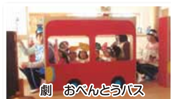
劇 おべんとうバス