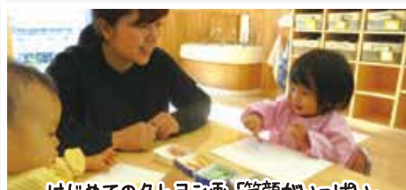
はじめてのクレヨン画「笑顔がいっぱい」