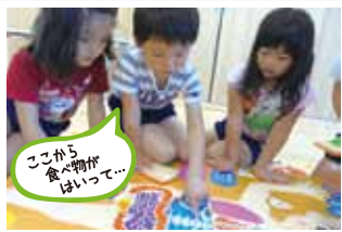
ここから 食べ物が はいて...