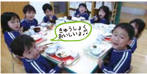
きゅうしょく おいしいよ!