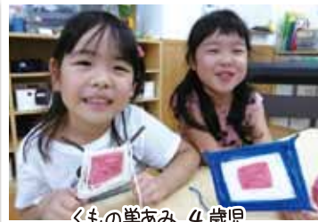
くもの巣あみ 4歳児