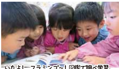
いたよ!ーフラミンゴー! 図鑑で調べ学習。