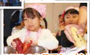
芋掘りのお芋でクッキング